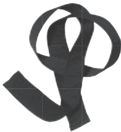
Kofferband Schwarz 8301 9112-99

Kofferband | Klettverschluss | Kratzfrei | Länge: 120 cm | Auf individuelle Länge einstellbar