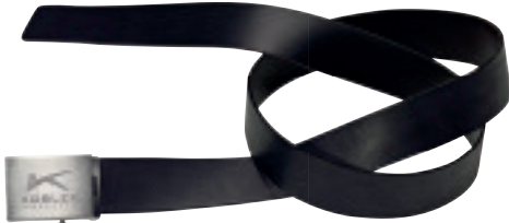
Leder Schwarz 8401 9111-99

Schließe Edelstahl | Nickelfrei | Länge: 115 cm | Auf individuelle Länge einstellbar