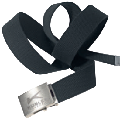
Kofferband Schwarz 8401 9113-99