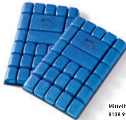
Mittelblau 8108 9119-45

Funktionelle Formgebung | Zertifiziert nach EN 14404:2004 + A1:2010 Typ 2, Leistungsstufe 1 in Verbindung mit dem jeweiligen Produkt (Bitte beachten Sie die entsprechenden Hinweise in der Artikelbeschreibung) | Universalgröße: Länge: 25cm, Breite: 15cm, Höhe: 2cm | Paarweise verpackt