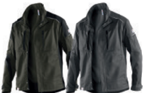
Oliv | Schwarz 1250 5365 - 6699 XS-4XL