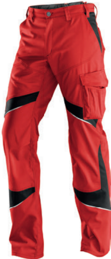
Mittelrot | Schwarz 2550 5365 - 5599 D34-D54