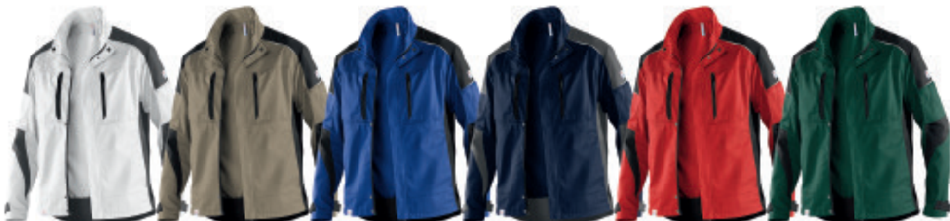
Weiss | Anthrazit 1250 5365 - 1097 XS-4XL