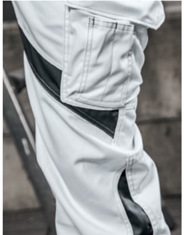
Stets geschmeidig. Dafür sorgt die extra Bewegungszone im Knie und das ergonomische Design.